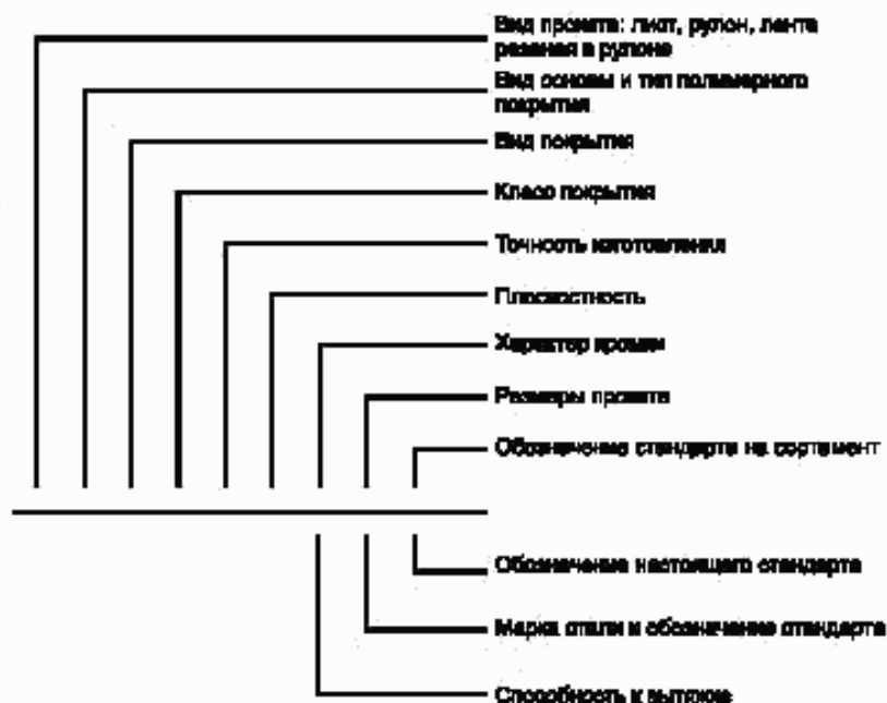
Схема условных обозначений проката с полимерным покрытием

Примечание — При отсутствии какого-либо из параметров его выбирает предприятие-изготовитель.